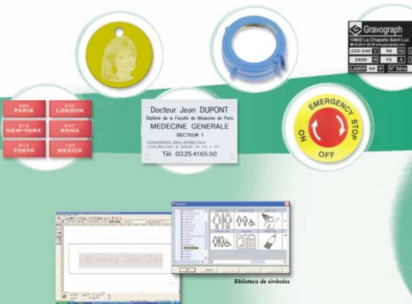
Composición en modo texto