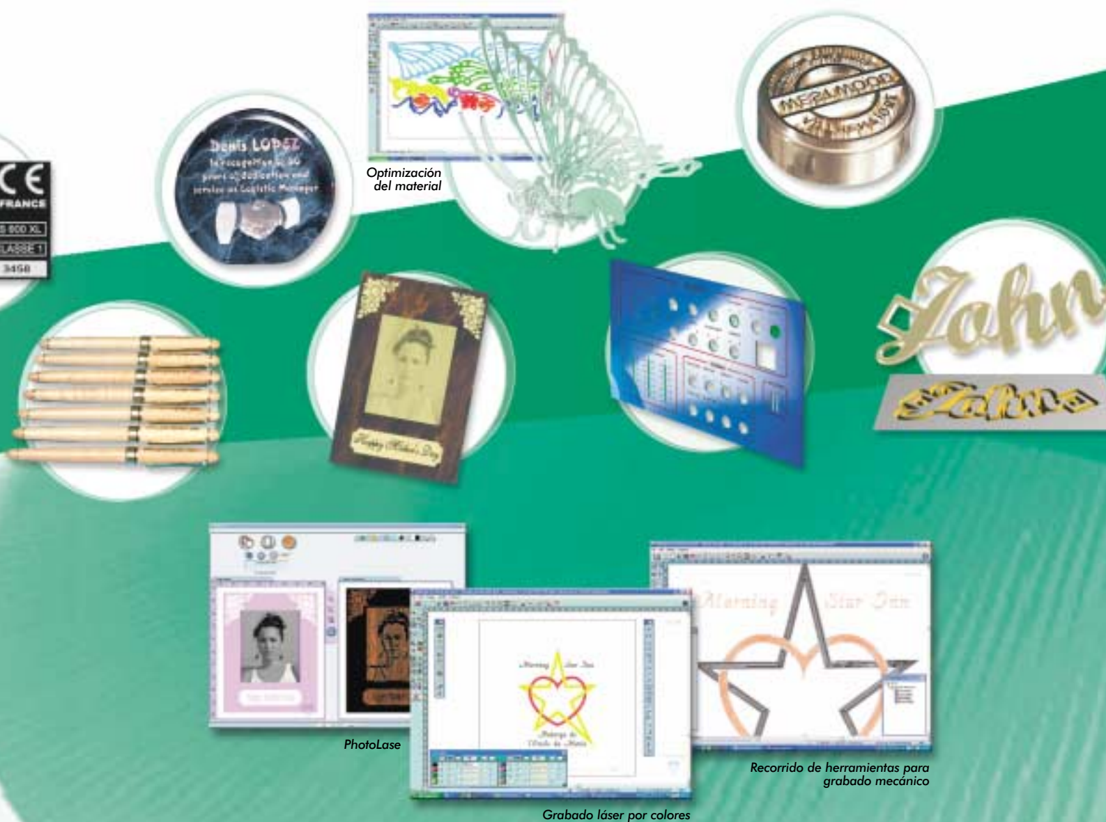
Optimización del material